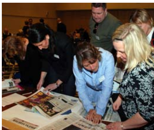
Praktiska övningar varvades med teori och teater när cheferna samlades på Foresta.